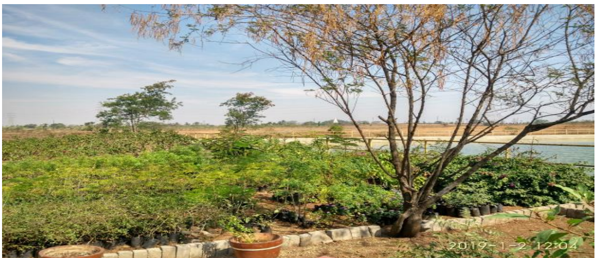
Snapshot of biodiversity area in the facility.